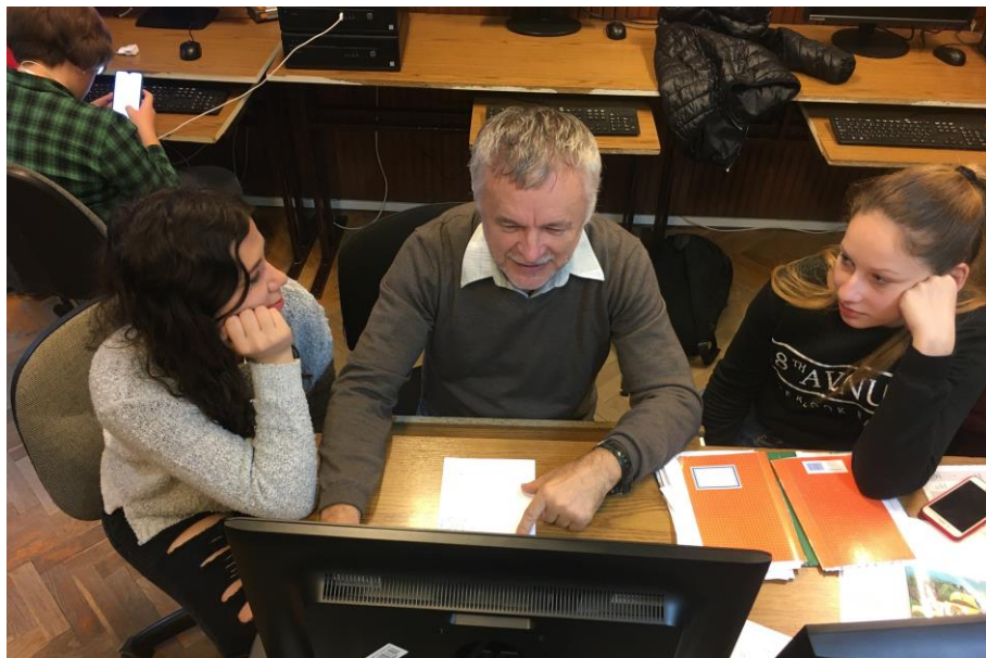
„Tanár Úr! Hagyjuk már az infót!” (infóóra a 10c-ben, 2020)*