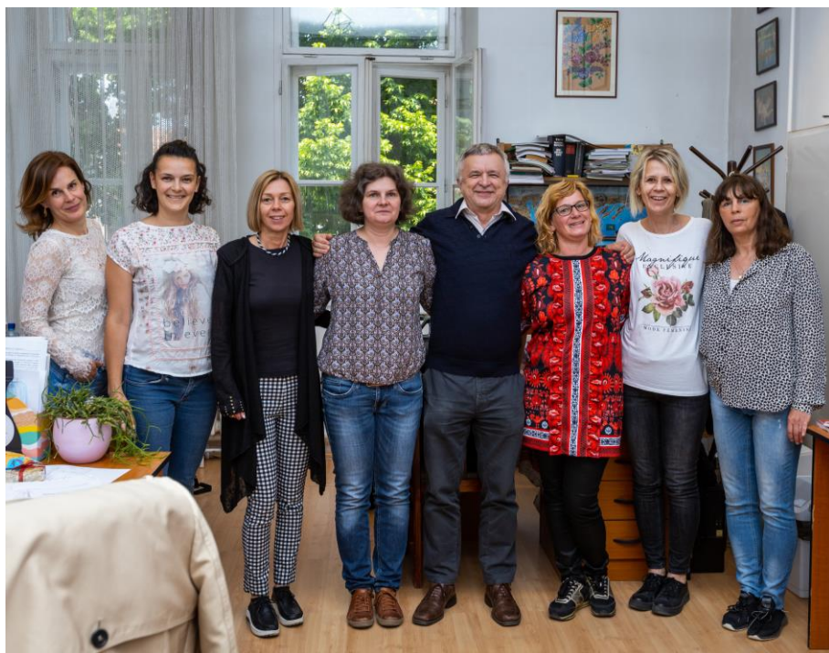
... és a kistanáriban (2021)