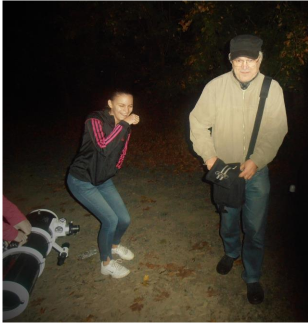
„Ilyen vicces vagyok?” (távcsöves bemutató a 11b-seknek, 2014)