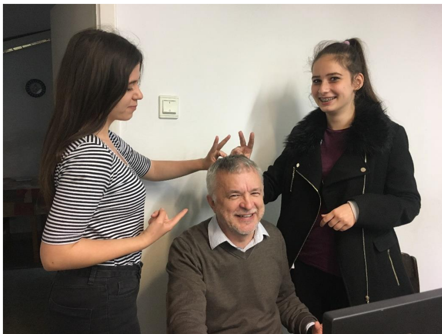
„Tanár Úr! MAGA nagy számár!” (infóóra a 9c-ben, 2019)