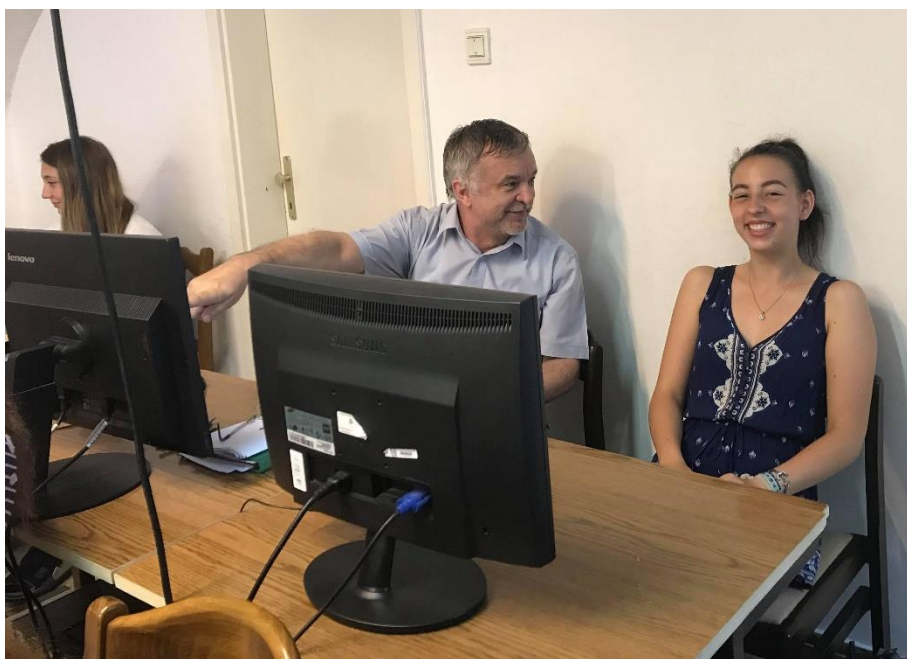
„Nati! Ide figyelj, ne a fotósra!” (infóóra a 10b-ben, 2018)