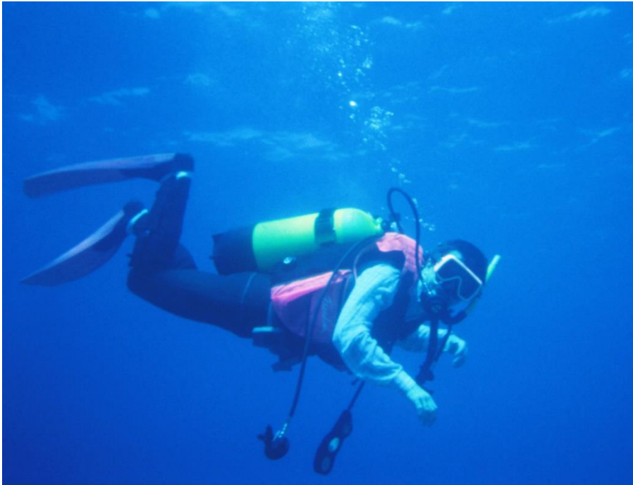
Könnyűbúvár fizika (Rabac, 1994)*