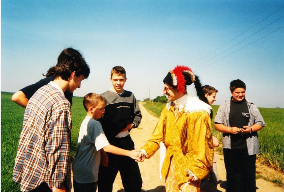
Utazás a múltba (9b-s osztálykirándulás, 2002)*