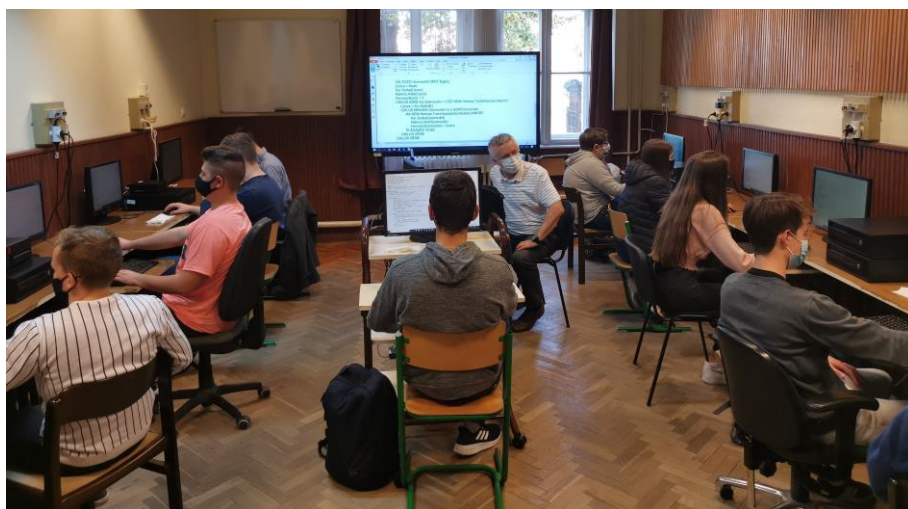
„Vírusvédelem” (infóóra a 9a-ban, 2020)