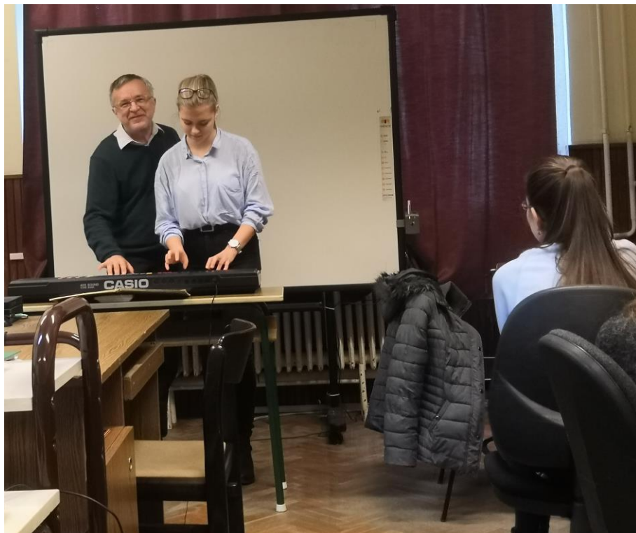
Karácsonyi kiskoncert (infóóra a 10b-ben, 2019)