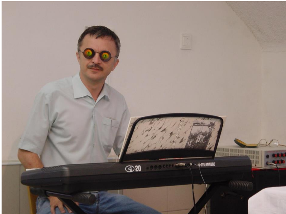
Buli van! (tantestületi összejövetel, 1998 körül)