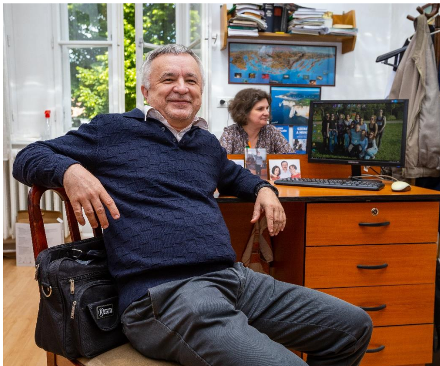
Mögöttem a (volt) kedvenc diákom (2021)