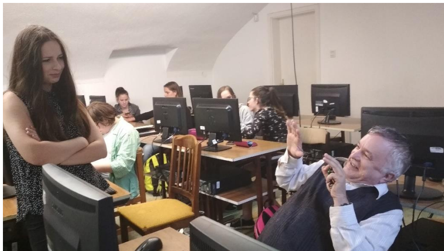
„Hogy is van ez, tanár úr?” (infóóra a 9c-ben, 2019)