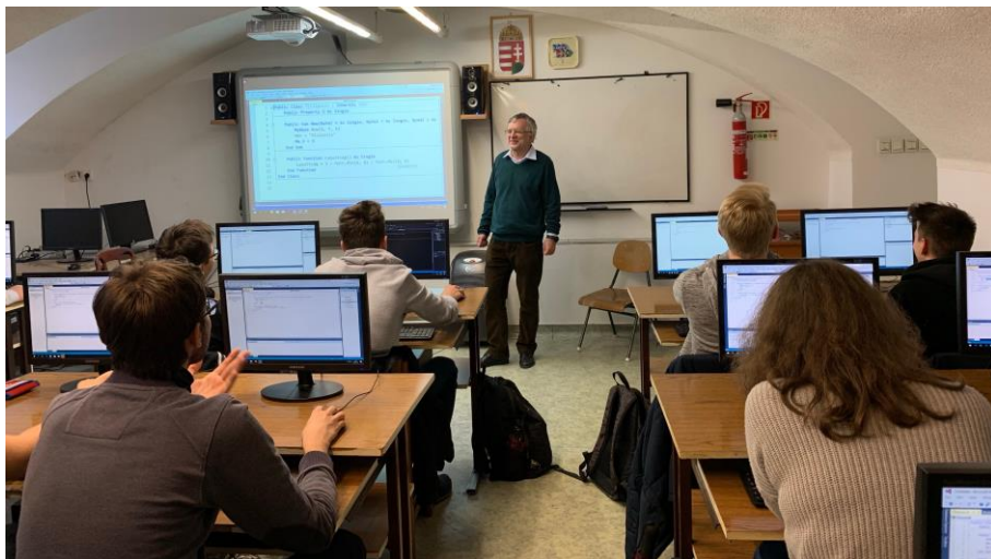
Public Sub New ☺ (infóóra a 10a-ban, 2018)