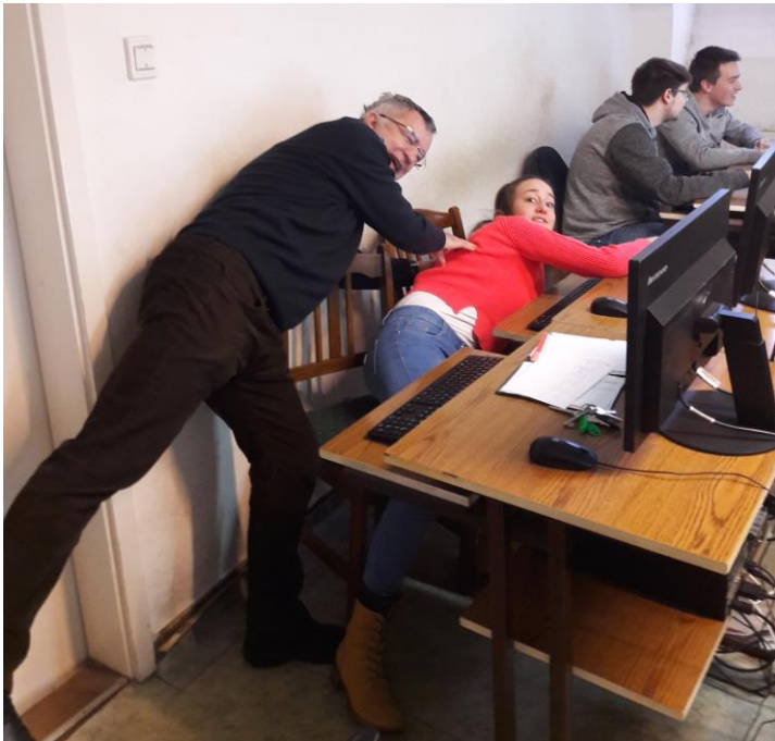
Fegyelmezés Makarenkó-módra (infóóra a 10a-ban, 2017)*