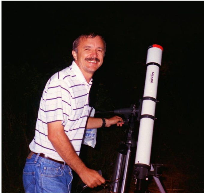
Sötétség délben (teljes napfogyatkozás, 1999. aug. 11.)*