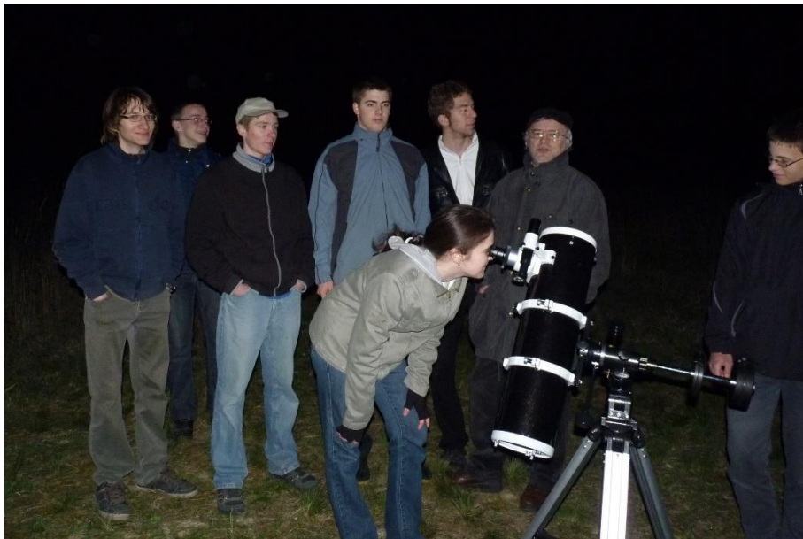
Körben áll egy kislányka... (dötki tábor, 2013)