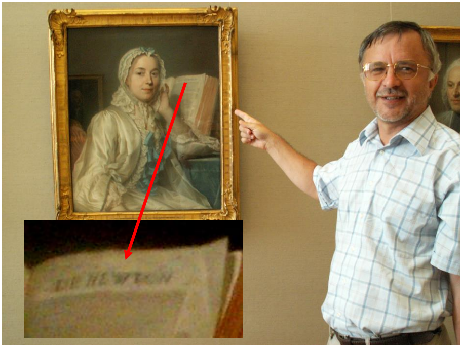
Festészet és fizika (De La Tour: Ferrand kisasszony Newtonon elmélkedik, 1753, Alte Pinakothek, München, 2008)