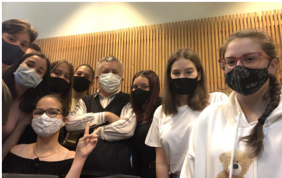
Nyugdíjas búcsúztató az infóteremben (9bny) ...